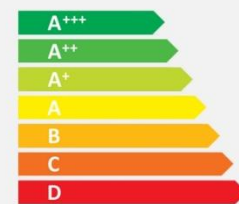
Old energy label