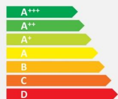
Old energy label